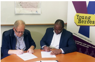
Neue Partnerschaft in Swasiland